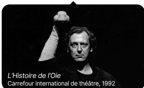
L'Histoire de l'Oie Carrefour international de théâtre, 1992

Voyage à travers les souvenirs de la première édition du Carrefour à la redécouverte de L'Histoire de l'Oie de Michel-Marc Bouchard, spectacle phare de l'histoire du théâtre québécois.